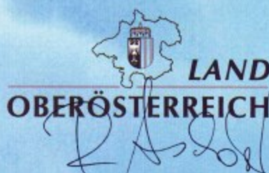
Rudolf Anschober Umwelt u. Energie-Landesrat